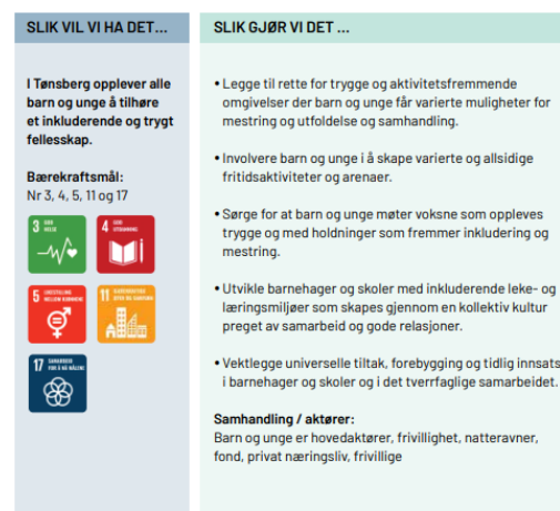
Figur 1 Utsnitt fra gjeldende samfunnsdel som viser hovedmål, delmål og strategier innenfor et satsingsområde.

I SAMHANDLING MED BARN OG UNGE SKAPER TØNSBERG VARIERTE ARENAER FOR INKLUDERING OG MANGFOLD, MESTRING OG AKTIVITET.